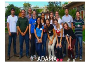
Semestre Académico en Brasil – Programa de Visitas UFPEL Universidad de Pelotas