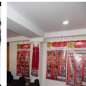
Semana Interculturalidad 2018 - RUSIA