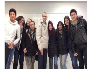
Grupo estudiantes participantes del programa Explora Ottawa

Para poder esclarecer aquellas transformaciones internas, socializamos a través de la ruta de la internacionalización en casa, los resultados obtenidos: