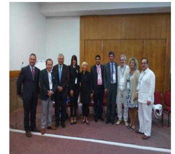
EIESTEC-OUI 2018 – Búzios- Brasil