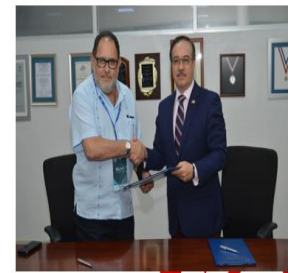
Firma Convenio con UTN (Costa Rica)