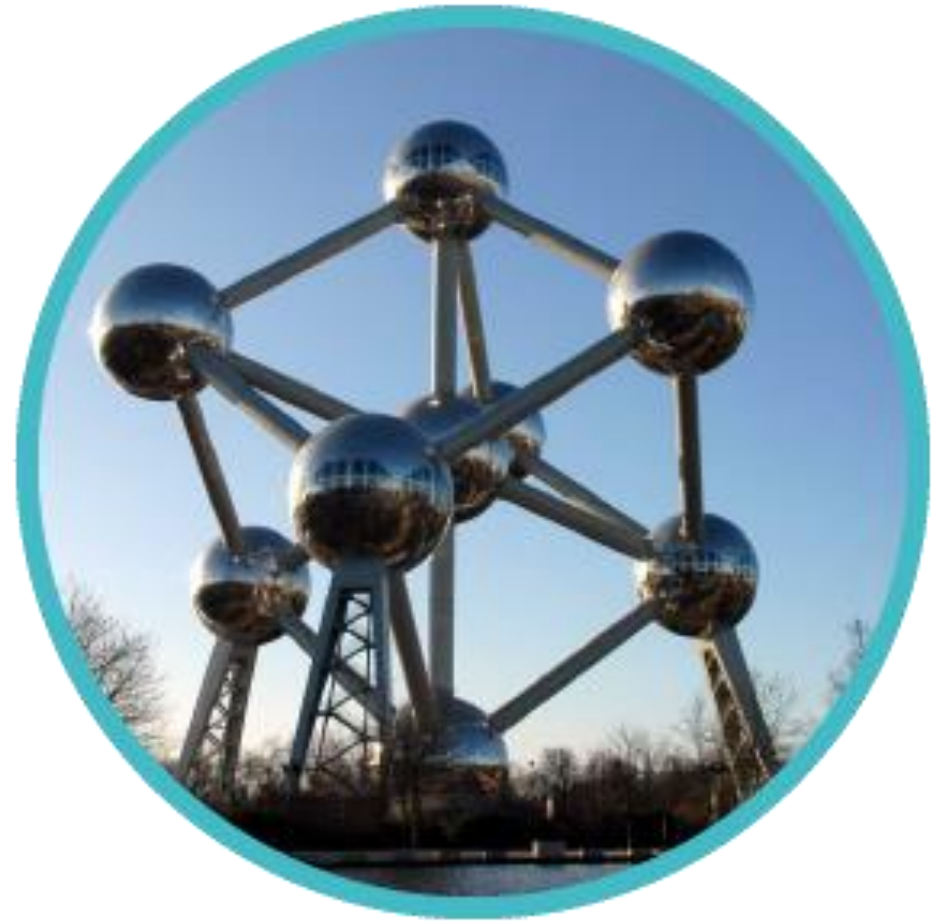
Atomium , Escultura de un cristal de Hierro – Bruselas, Feria Mundial 1958

A raíz de la expedición de la ley 80 de 1980 del MEN, se constituyó como: Corporación Tecnológica de Bogotá , con Personería Jurídica otorgada mediante resolución 6271 de Mayo de 1983.